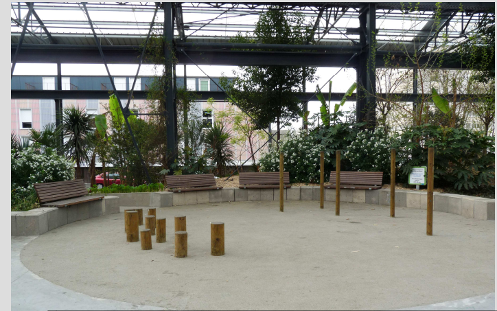
Un espace de récréation à l'abri des intempéries.