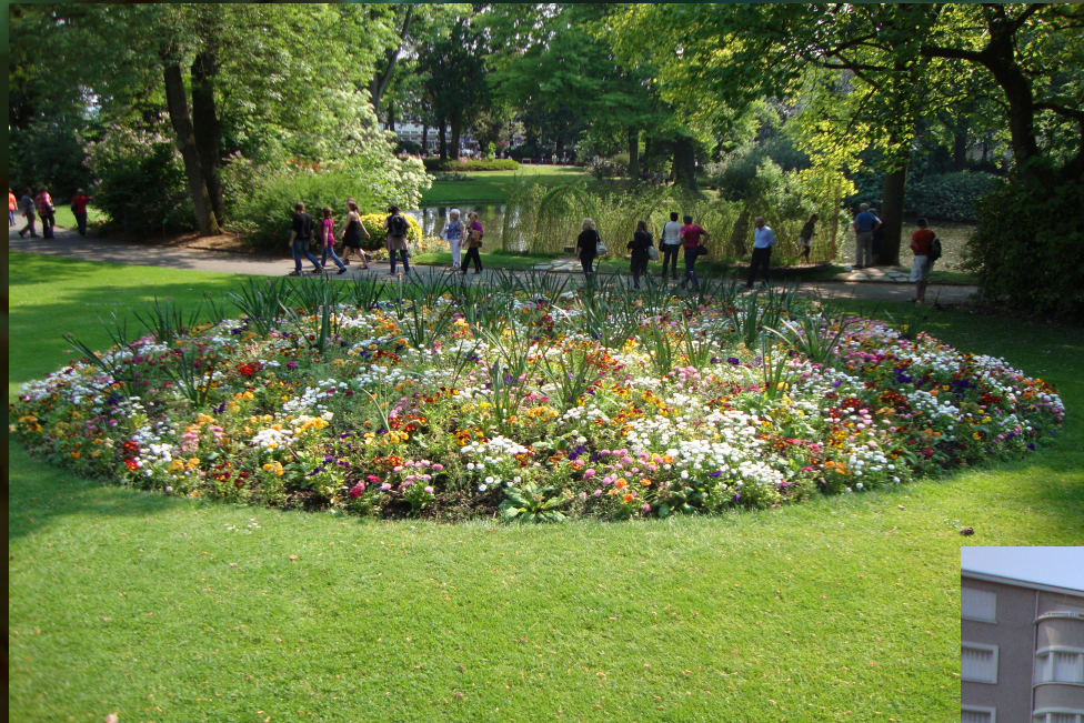
Venez découvrir le Jardin des Plantes, parc dans la ville qui présente ses riches collections botaniques