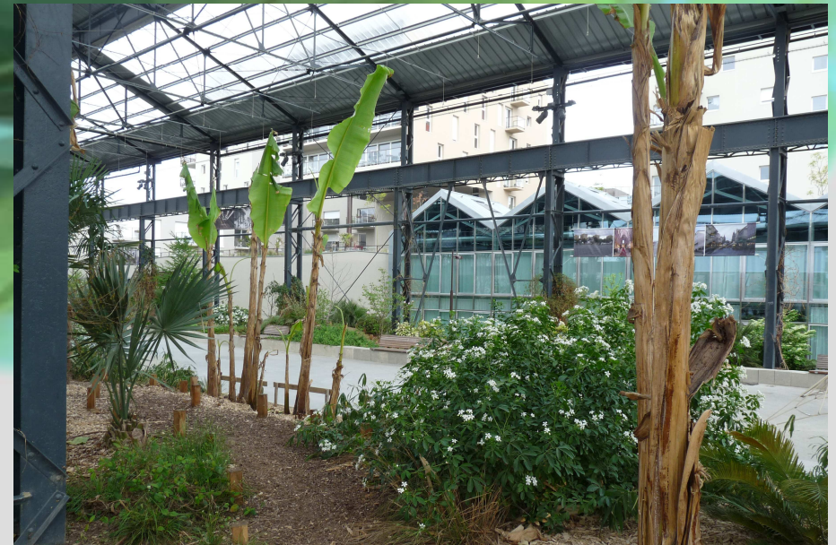
Une végétation exotique dans un ancien lieu de travail des métaux