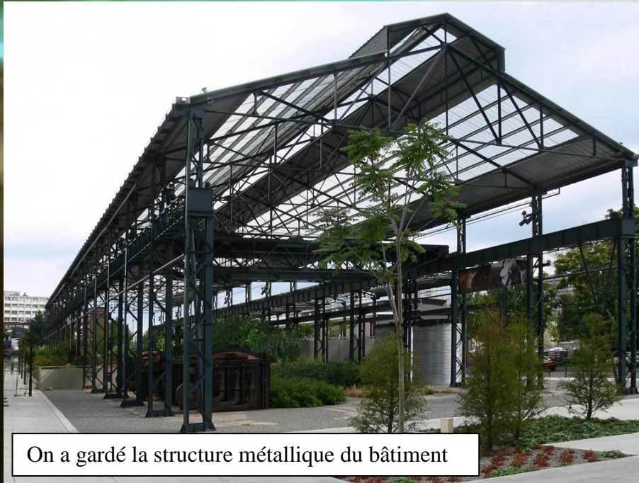
On a gardé la structure métallique du bâtiment

Sur 3200 m 2 , des plantes de toutes espèces se partagent le terrain avec les anciens fours et fosses, vestiges de l'ancien chantier. Certaines plantes s'acclimatent très bien au climat nantais, d'autres moins. L'objectif principal du jardin est de permettre l'ouverture du quartier aux autres quartiers de la ville.