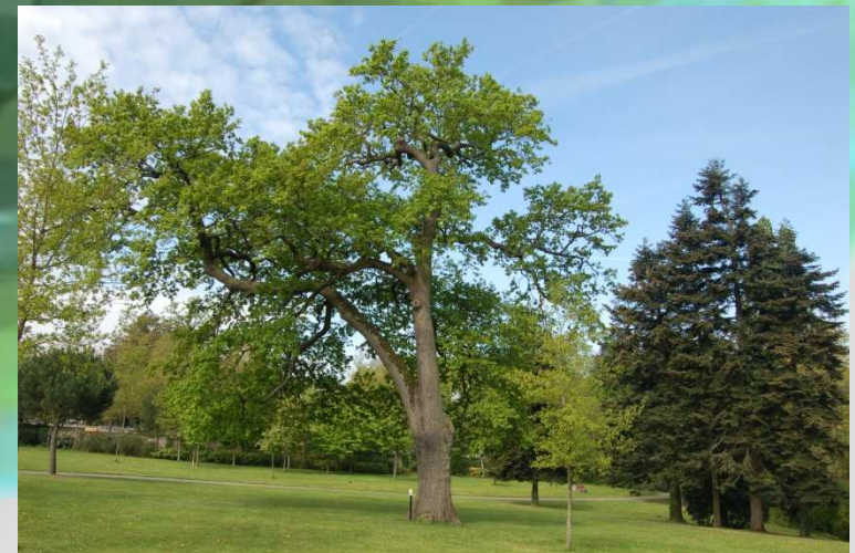
Chêne pédonculé dans le parc de la Gaudinière. ( Quercus robur )