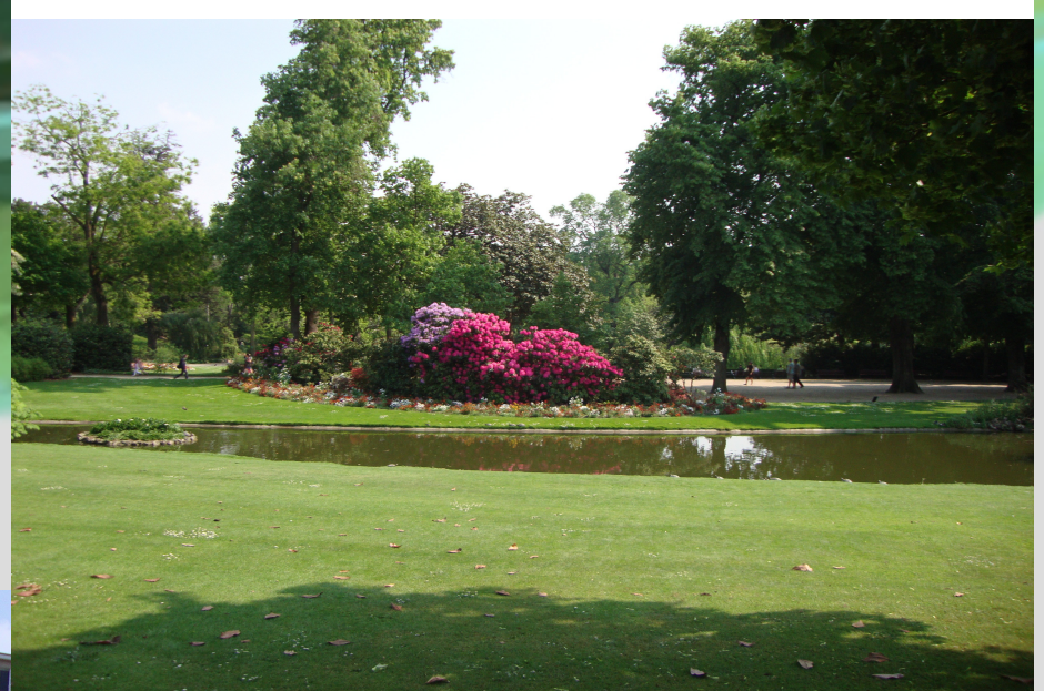
Un endroit où l'on se croit en pleine nature!