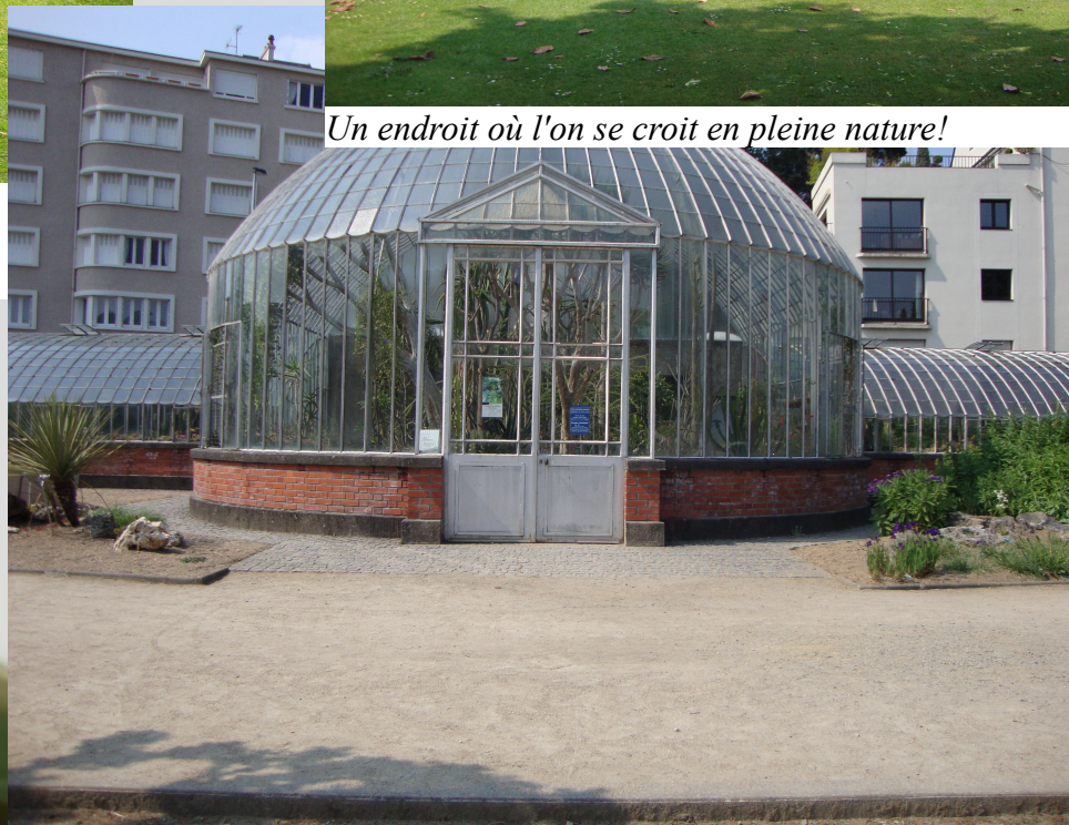
Visitez la serre tropicale avec ses verrières du 19ème siècle !