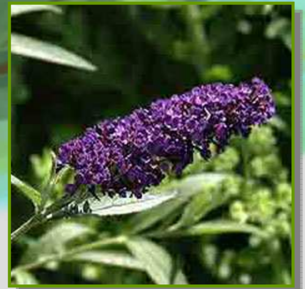
Buddleia davidii : la fleur la plus répandue dans le jardin

La végétation se referme sur les allées, les arbustes se développent et le lierre court au sol.