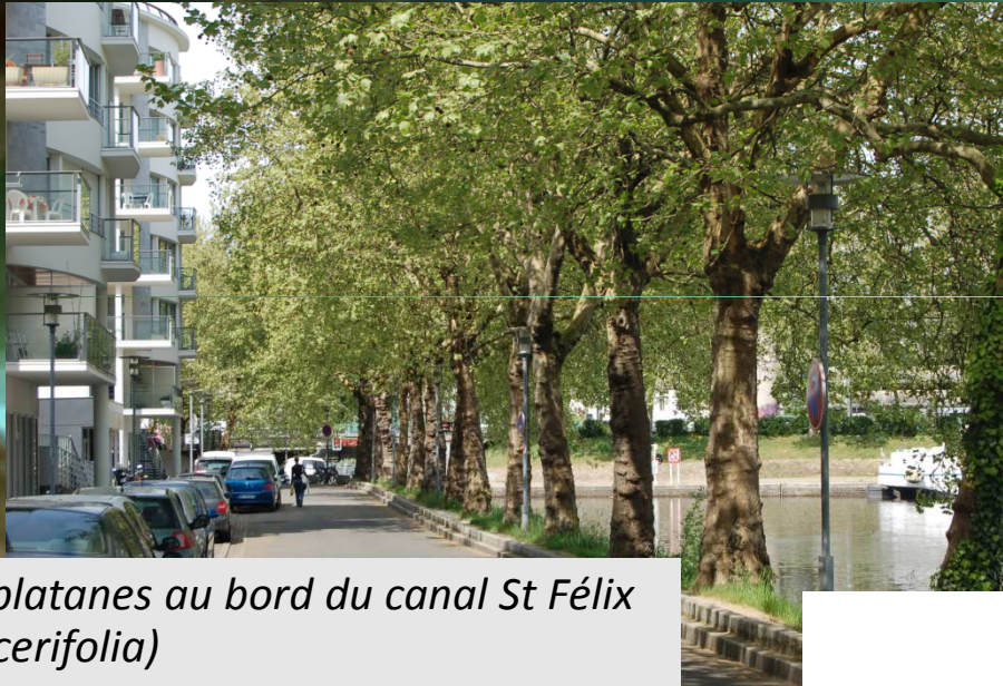
Rangée de platanes au bord du canal St Félix ( Platanus acerifolia )